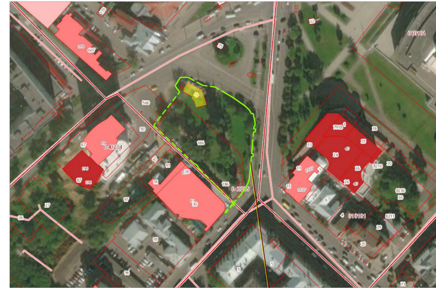
- граница благоустройства территории сквера