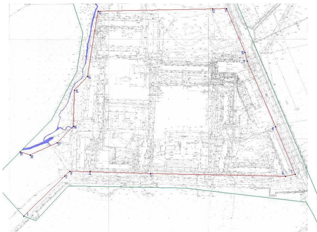
Рисунок 038. Схема нумерации отступов от красных линий в границах проектируемой территории