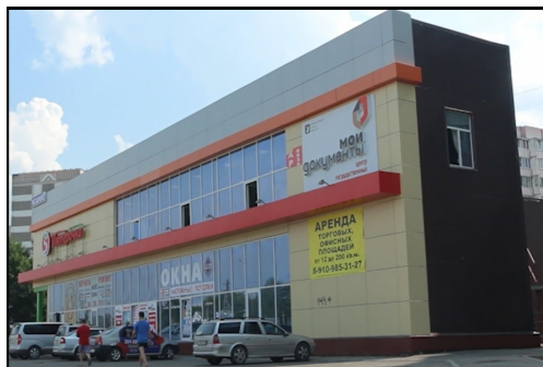
Отдел «Ленинский» ул. Куконковых, 144А 2 этаж (остановка транспорта «АШАН»)