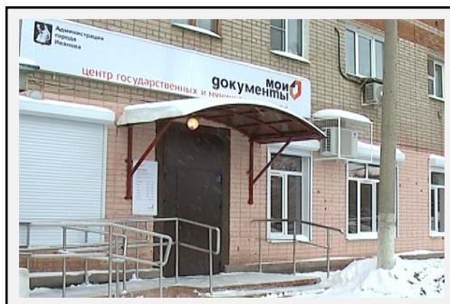
Отдел «Фрунзенский» ул. Красных Зорь, 10 (остановка транспорта «пос.Рабочий (ул.Ленинградская)»)