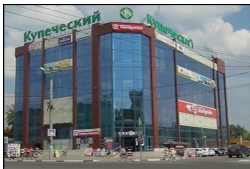
Отдел «Октябрьский» пр. Ленина, 108 ТЦ Купеческий 4 этаж (остановка транспорта «Станционная»)