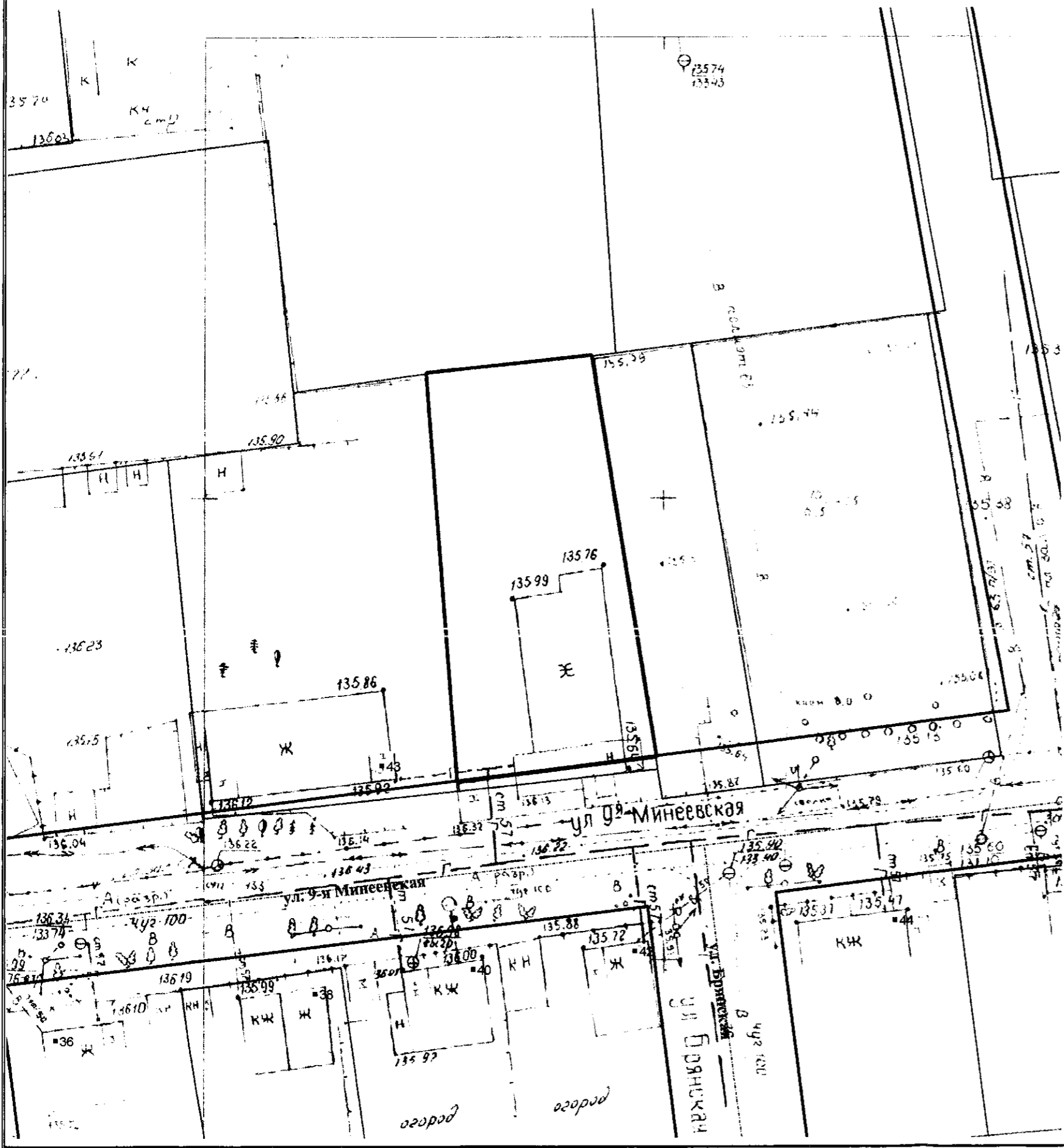
СХЕМА РАСПОЛОЖЕНИЯ ЗЕМЕЛЬНОГО УЧАСТКА ПО АДРЕСУ: ГОРОД ИВАНОВО, УЛИЦА 9-МИНЕЕВСКАЯ, ДОМ 45, ДЛЯ ИНДИВИДУАЛЬНОГО ЖИЛИЩНОГО СТРОИТЕЛЬСТВА М 1:500